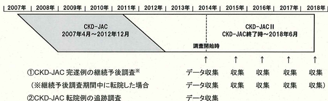
図 1. 調査期間及び調査時期